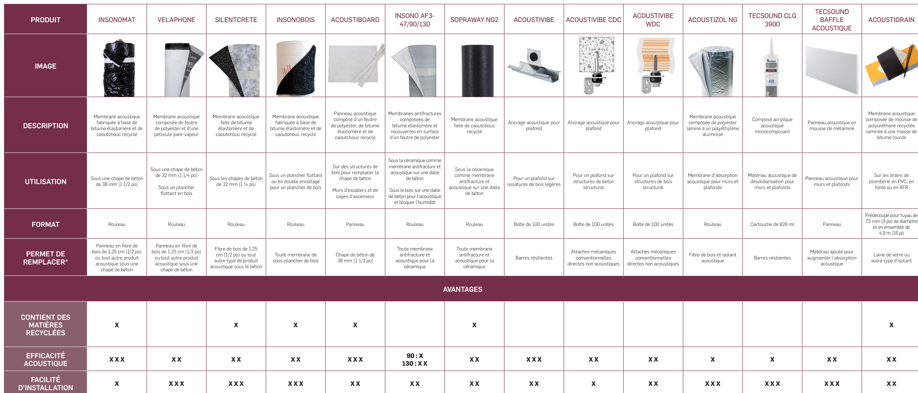
TABLEAU COMPARATIF DES MEMBRANES ET DES PRODUITS ACOUSTIQUES POUR LES SYSTÈMES D'INSONORISATION

* Nos produits d'insonorisation permettent de remplacer différents éléments dans la composition des assemblages afin d'obtenir une performance acoustique supérieure.